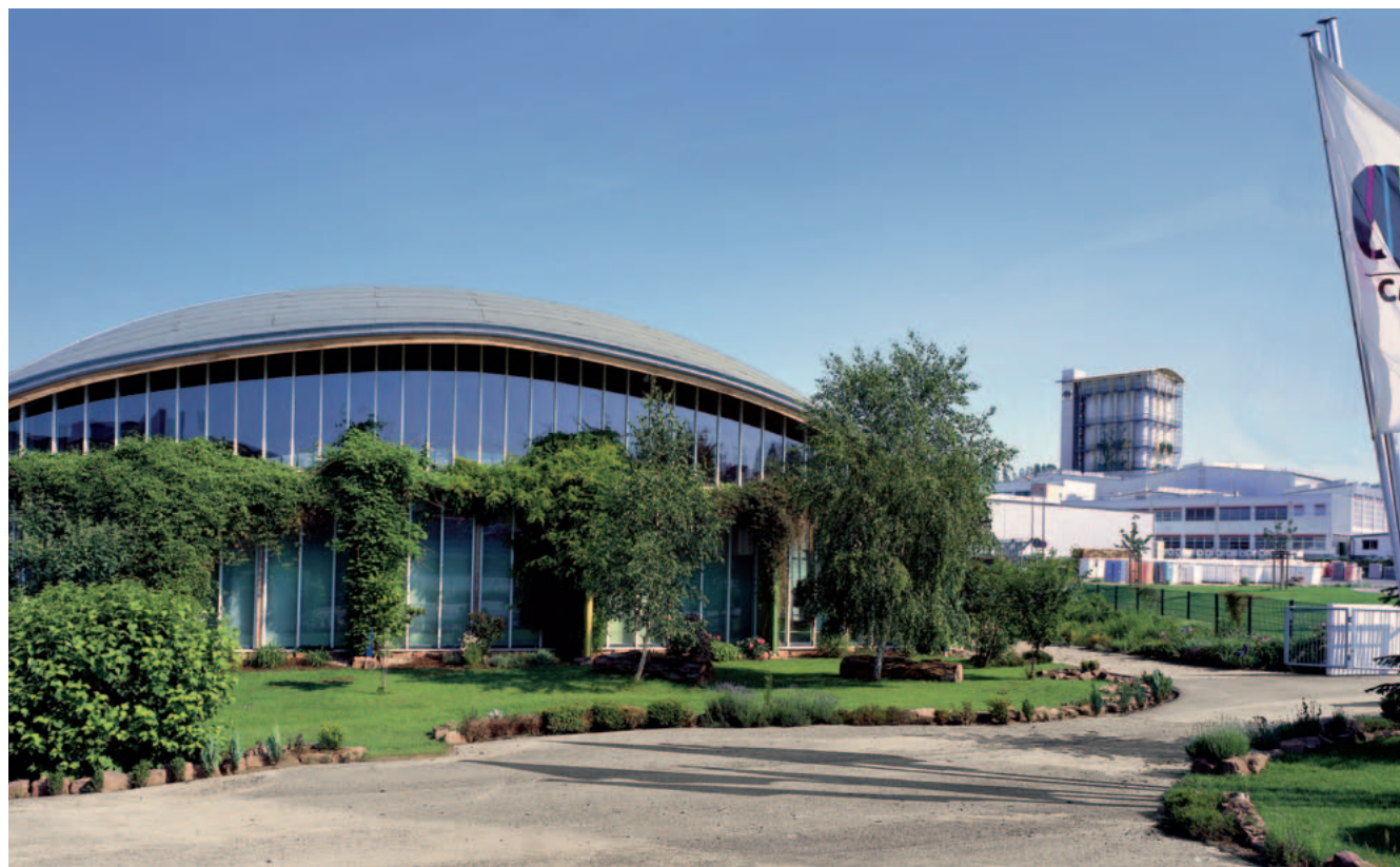
Dom remesiel, školiace a výstavne centrum v Ober-Ramstade