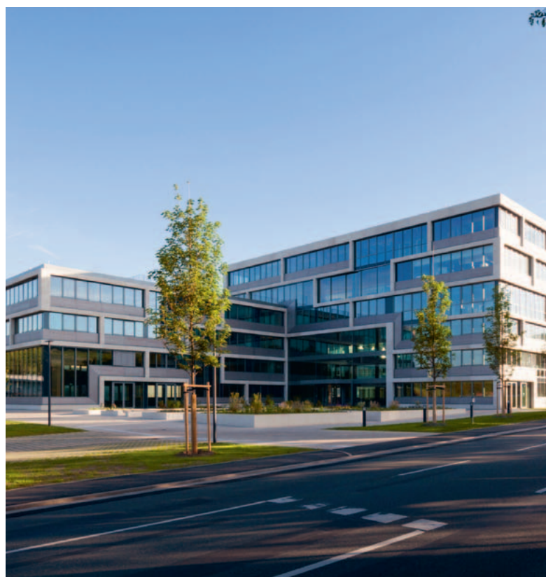
Sídlo skupiny DAW v Ober- Ramstade