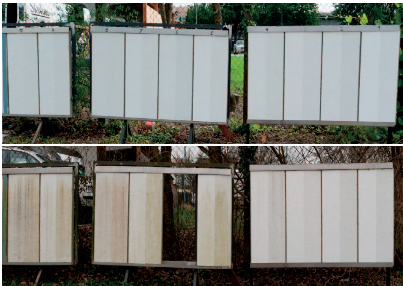
Caparol testovacie centrum v Pergu (Rakúsko), kde sú rôzne materiály, vrátane konkurenčných, vystavené dlhodobému vplyvu podnebia. Dole stav po 5 rokoch.